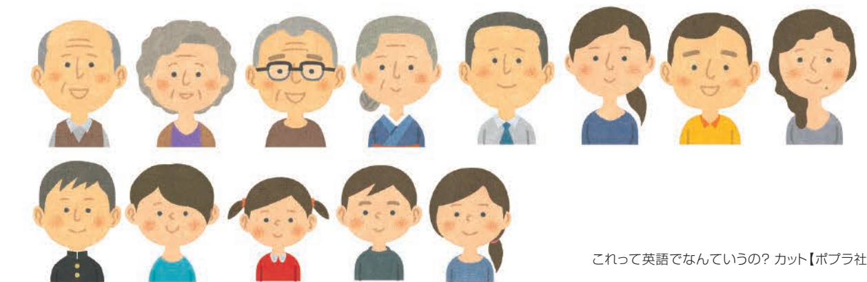
これって英語でなんていうの? カット【ポプラ社】