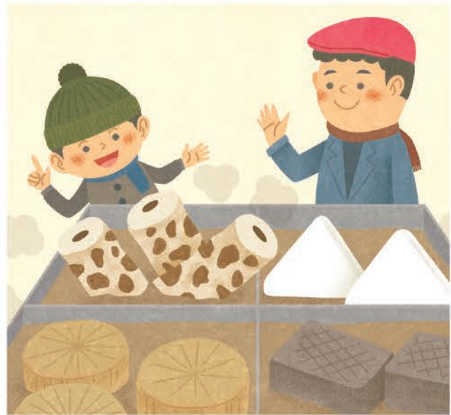
こどもちゃれんじ カット【ベネッセ】