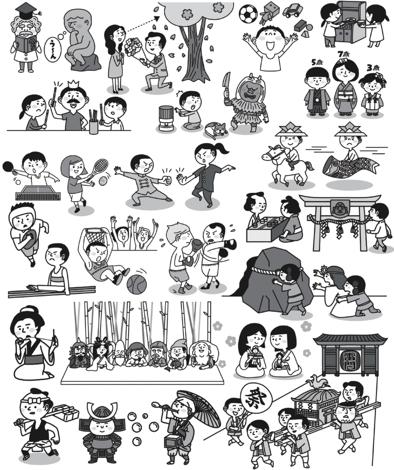
ことばの由来博物館-行事と遊びのことば【ほるぷ出版】