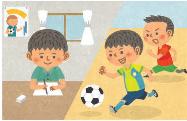
会報誌Meit カット【明光義塾】