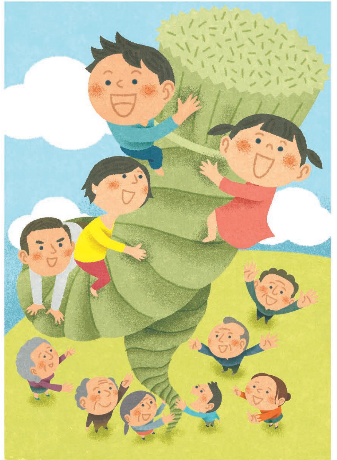
しめ縄プロジェクト パンフレット【国際教養振興協会】