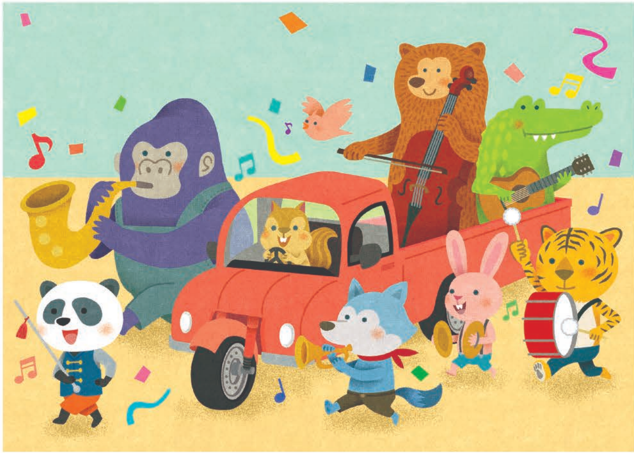
せいさくちょう 表紙【フレーベル館】