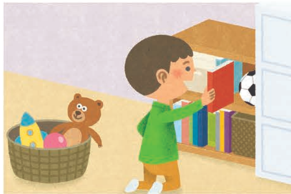
すてっぶ通信 カット【ベネッセ】