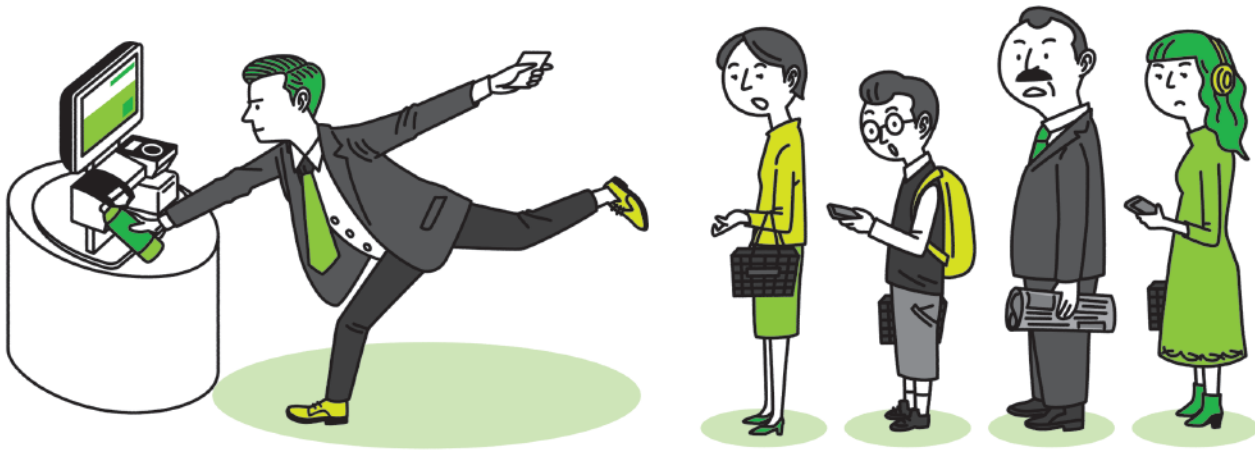
デジタルサイネージ「トレインチャンネル」【JR東日本】