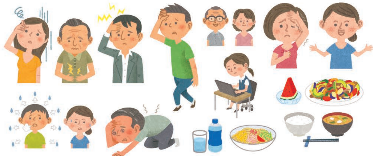
季刊誌「夏のけんこう」カット【社会保険出版社】