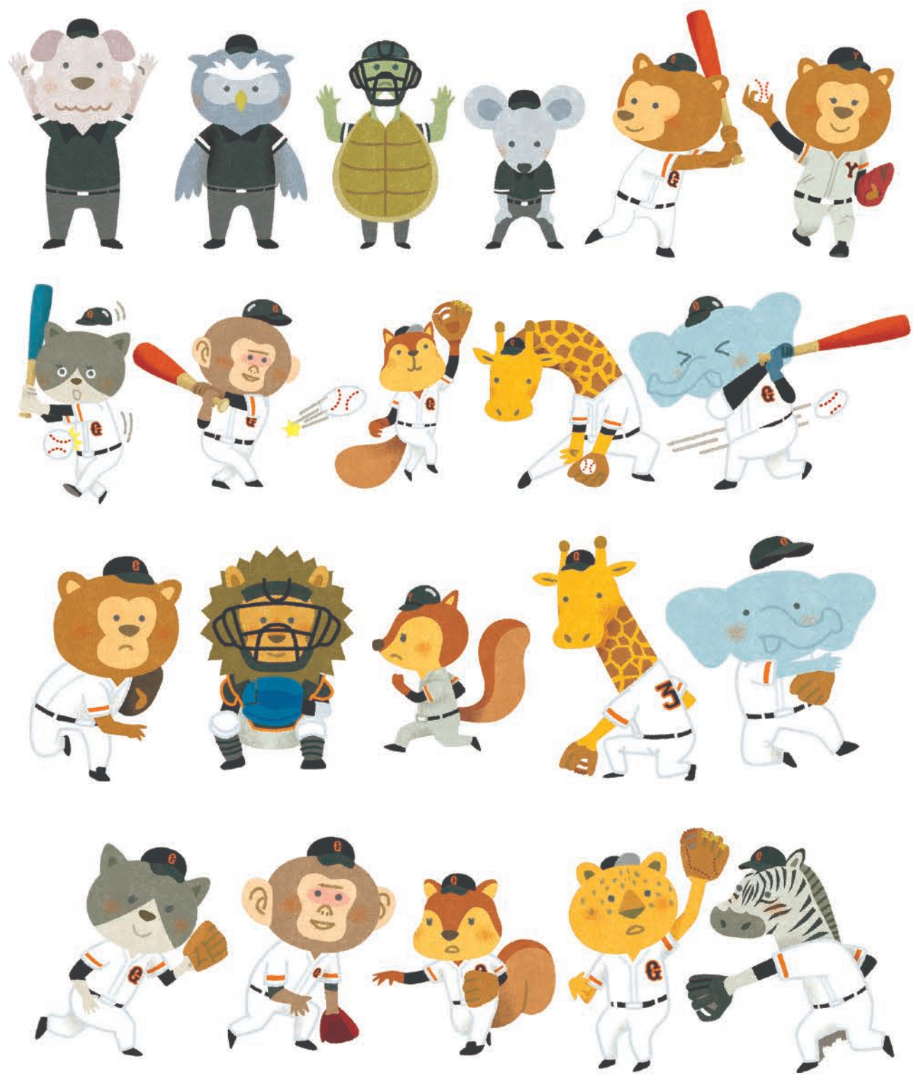
リーフレット「野球であそぼう!」キャラクター【読売巨人軍】