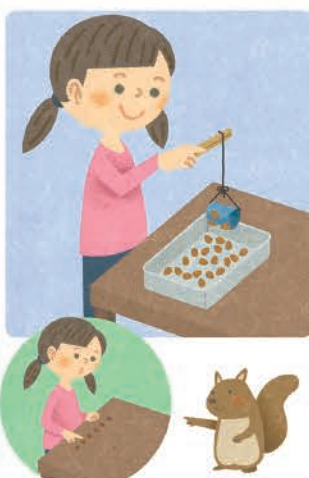
べあぜっと カット【Z会】