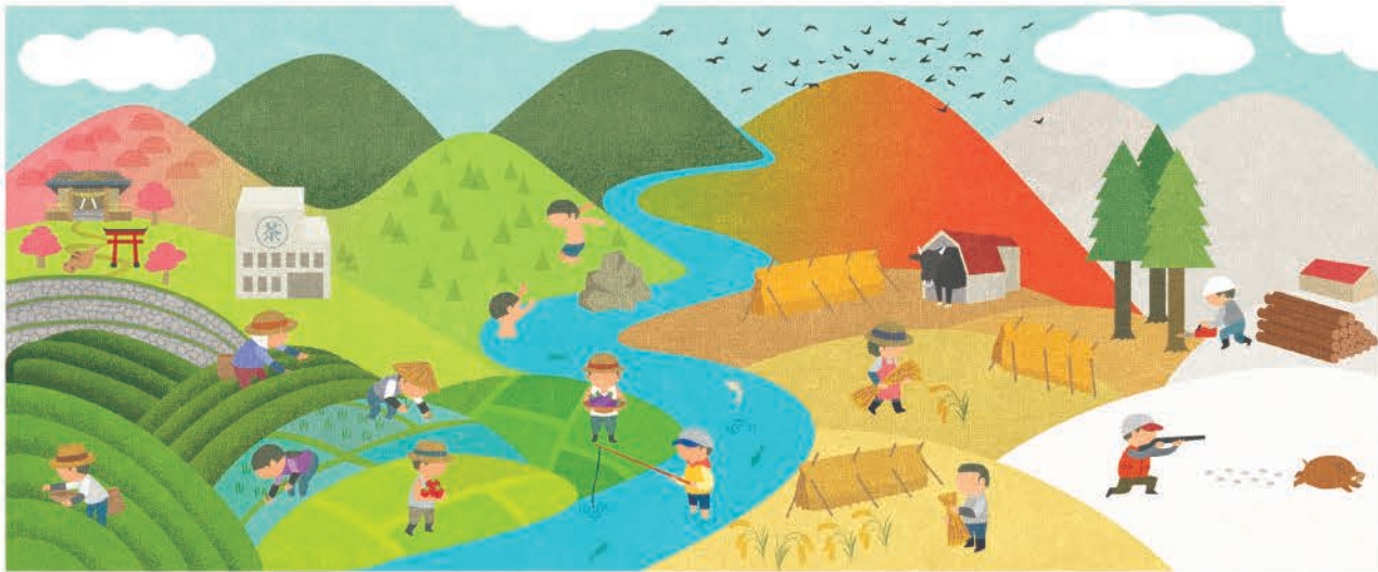
みのりの郷東白川株式会社ウェブサイト ビジュアル