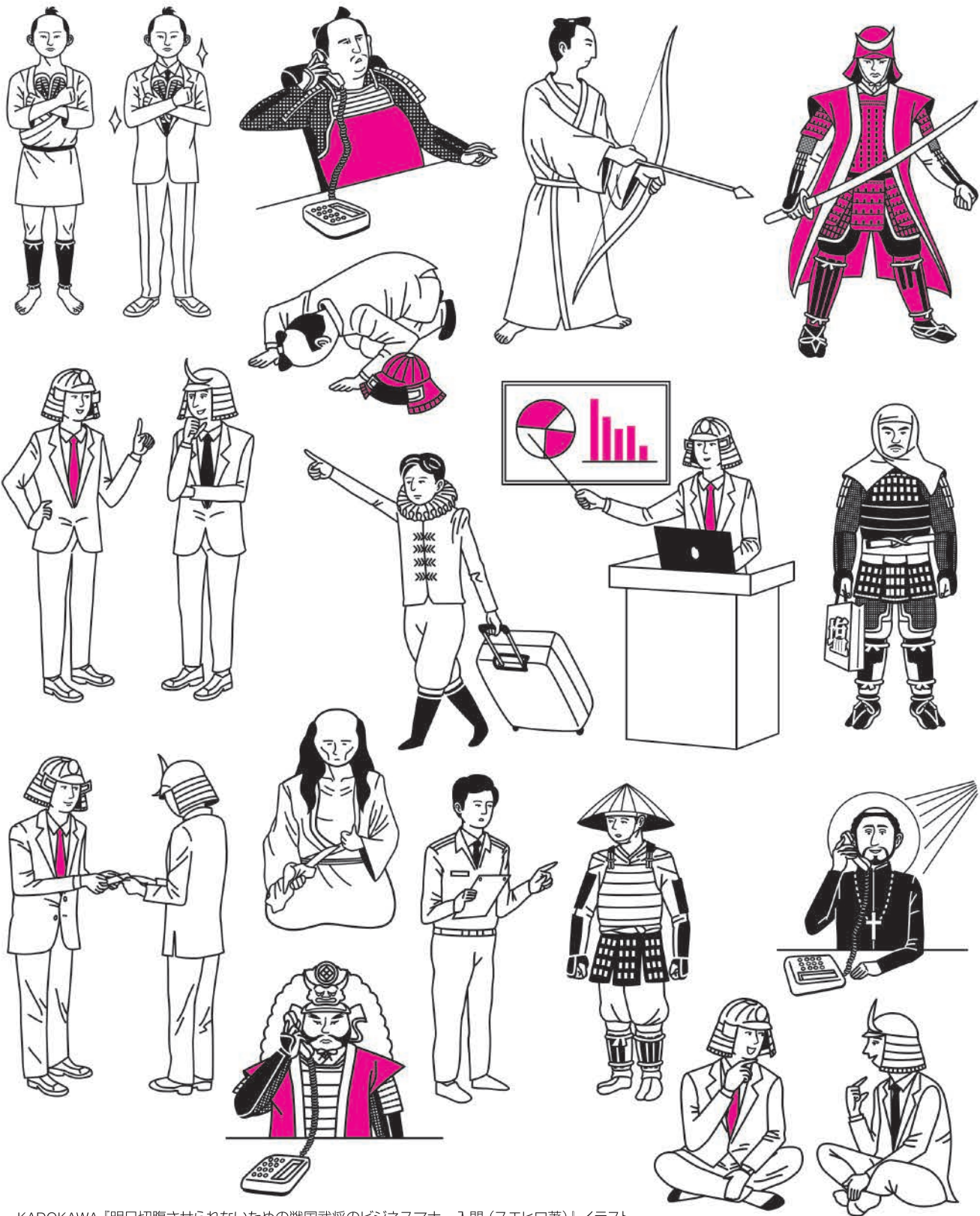
KADOKAWA『明日切腹させられないための戦国武将のビジネスマナー入門 (スエヒロ著)』イラスト