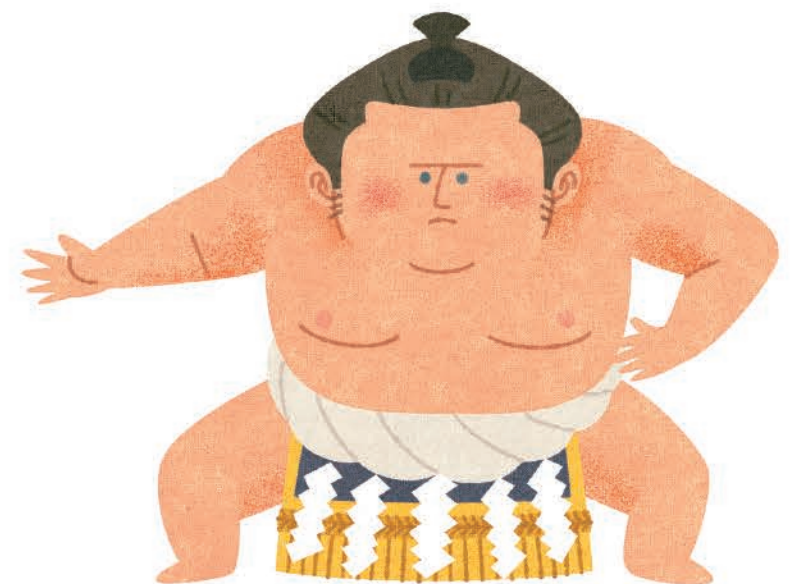
「入間市じゃらん」カット