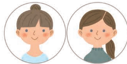
防犯警備会社サービス案内カット