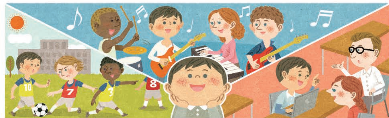
教育系ウェブサイト内バナー