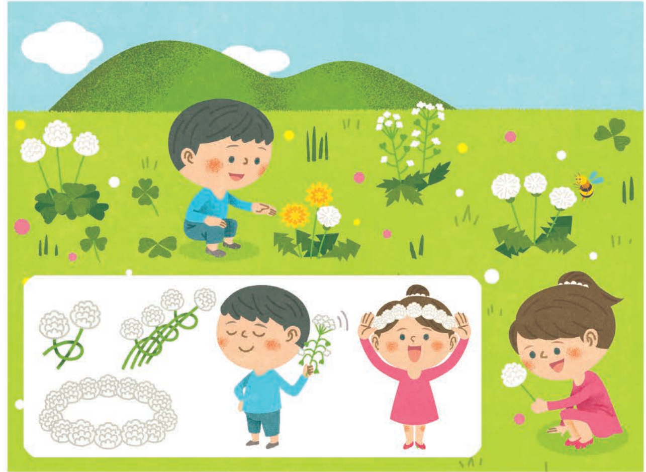
フレーベル館「キンダーブック2」