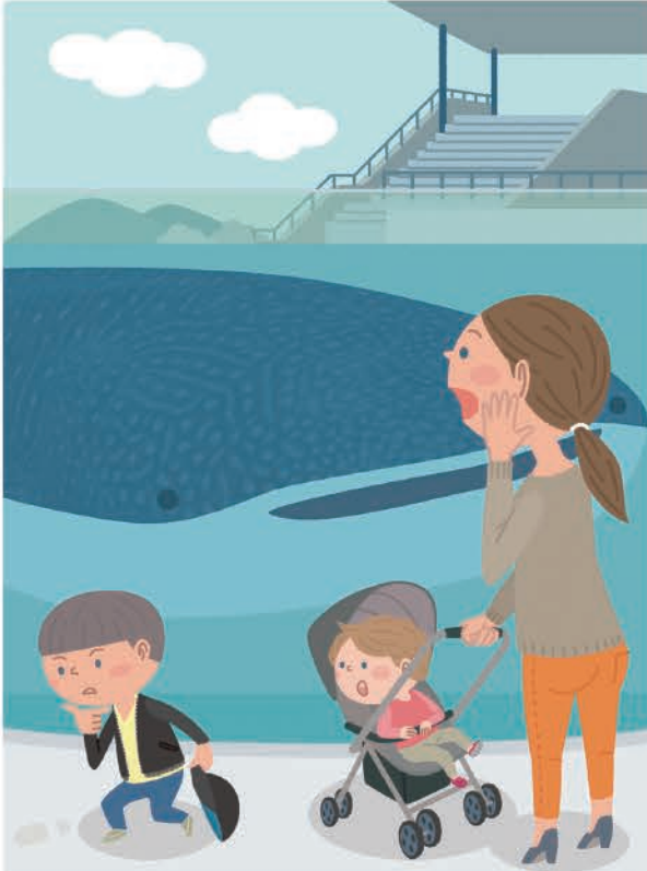
電子書籍「ママさん探偵律子の事件簿3」表紙