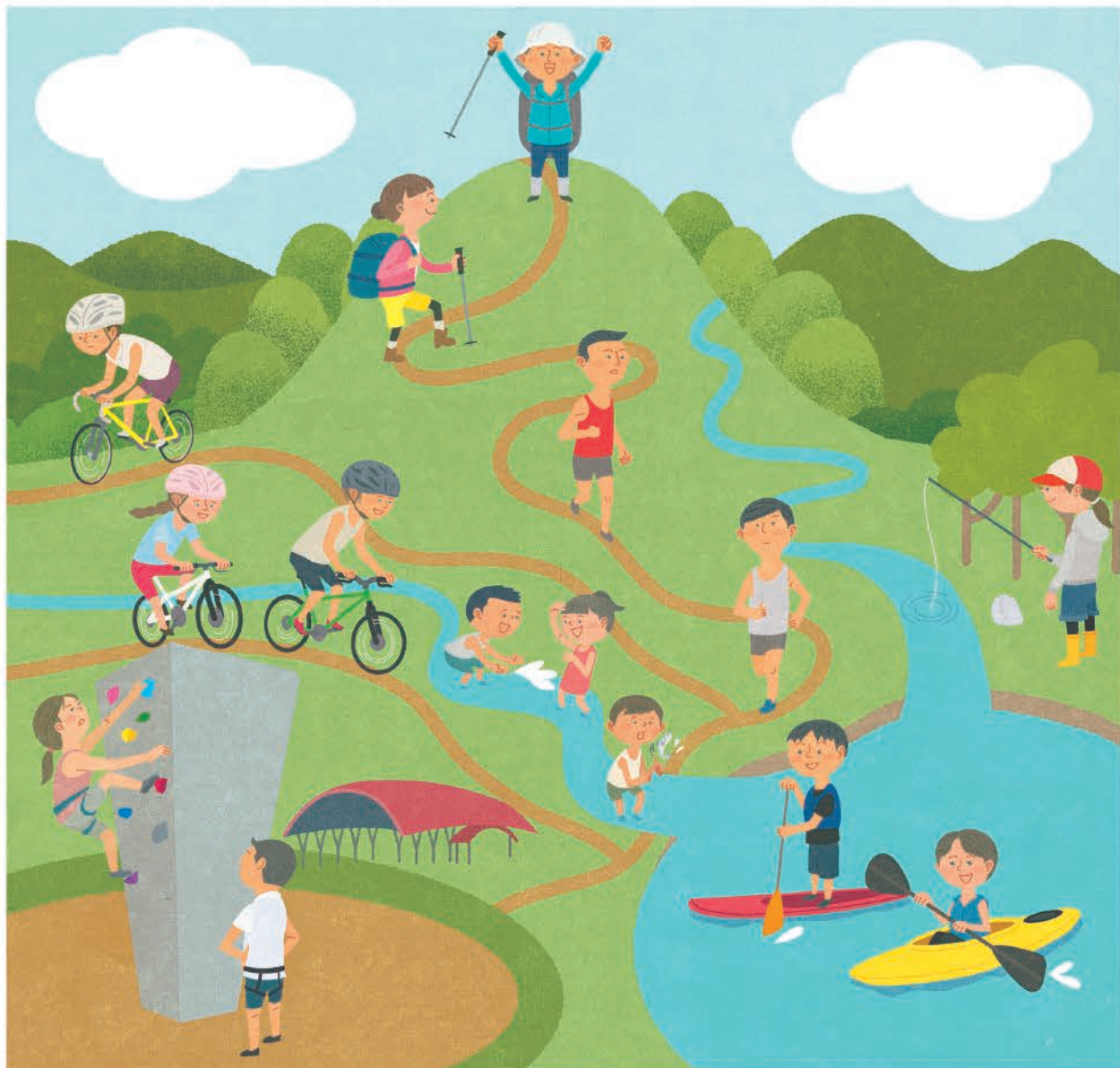
OSJ 46号 王滝村マップ