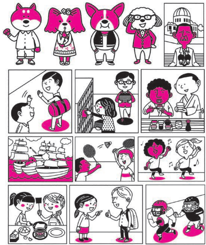
新星出版社「いちばん優しい英検準2級」カット