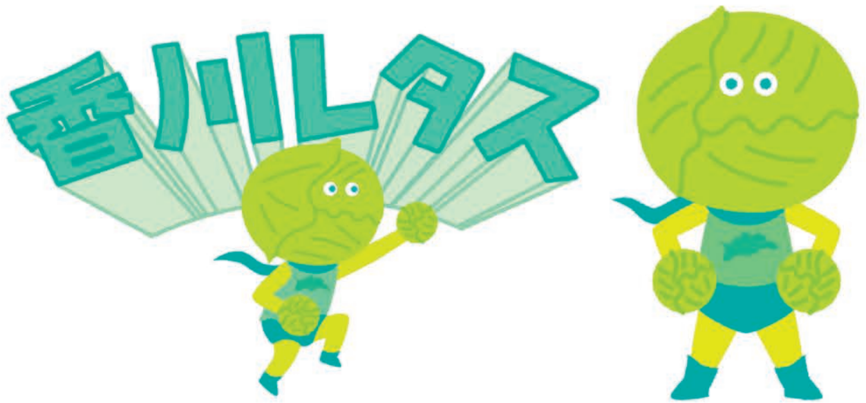
香川レタス ダンボール用キャラクター