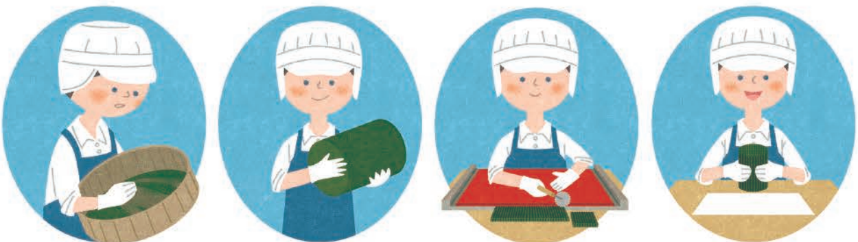
滝川株式会社「Beauty Gallery vol.36」カット