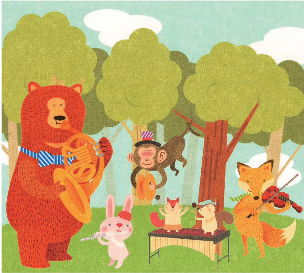
グリコ カフェオーレ「ひとゆるみオーケストラ」キャラクター